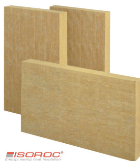
ISOROC Energy saving heat insulation

Przedsiębiorstwo ISOROC Polska S.A. powstało w 2004 roku i jest producentem najwyższej jakości ekologicznych produktów z wełny mineralnej. Poprzez szeroką ofertę systemową wysokiej jakości produktów izolacyjnych, stosowanych w budownictwie, ISOROC POLSKA umacnia swoją „młodą” markę na polskim rynku budowlanym. Produkty ISOROC dzięki wysokiej izolacyjności cieplnej